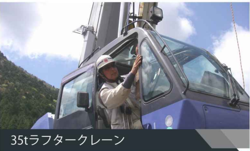
35tラフタークレーン