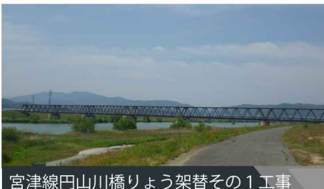
宮津線円山川橋りょう架替その1工事