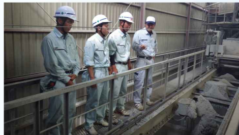
生コンプラント機械説明