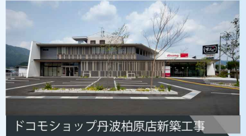
ドコモショップ丹波柏原店新築工事