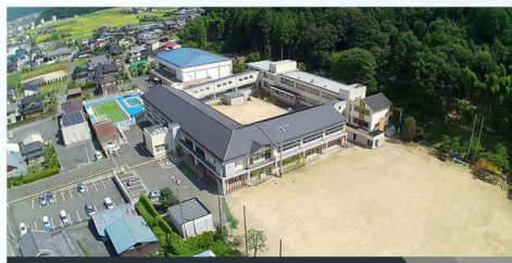
新井小学校北校舎改築工事