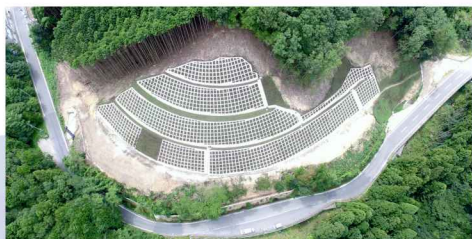
(主) 春日栗柄線滝ノ尻切土工事(その8)