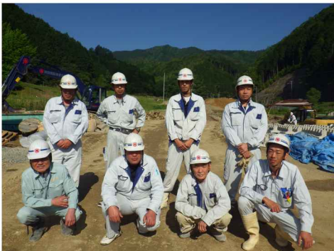
現場担当職員集合