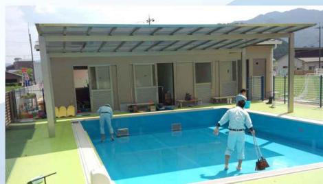
プール開き前のプール掃除のお手伝い