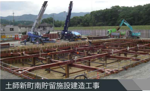
土師新町南貯留施設建造工事