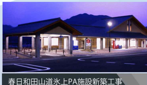
春日和田山道氷上PA施設新築工事