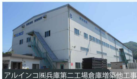
アルインコ(株)兵庫第二工場倉庫増築他工事