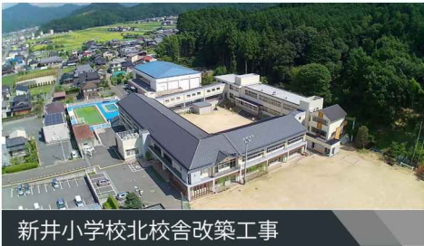
新井小学校北校舎改築工事