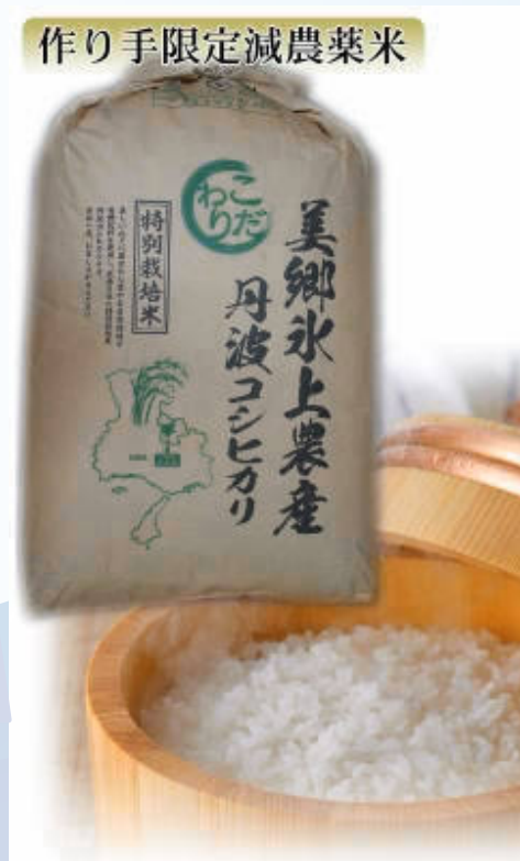
作り手限定減農薬米