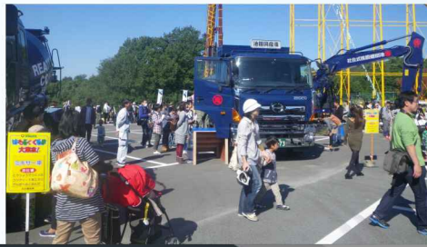
加東市観光協会主催『はたらくくるま大集合!』参加