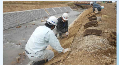
現場作業体験 (芝張り)