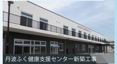
丹波ふく健康支援センター新築工事