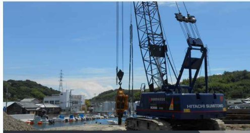
八家川水系八家川八家川水門下部工工事