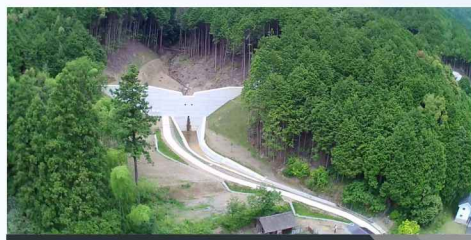
(砂) 南油良西谷川砂防堰堤工事