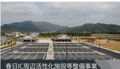
春日IC周辺活性化施設等整備事業