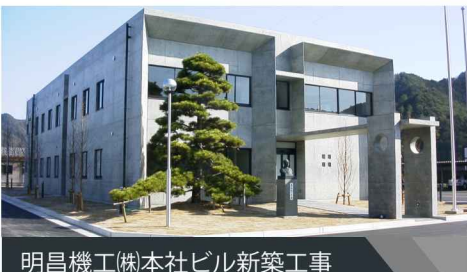
明昌機工(株)本社ビル新築工事