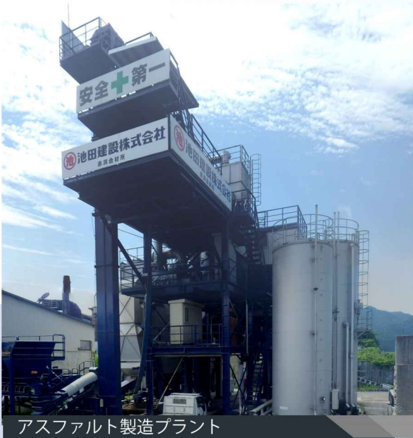
アスファルト製造プラント