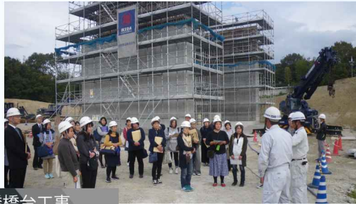
加古川小野線東播磨道北工区宗佐第一高架橋橋台工事 県立工業高校の現場見学会