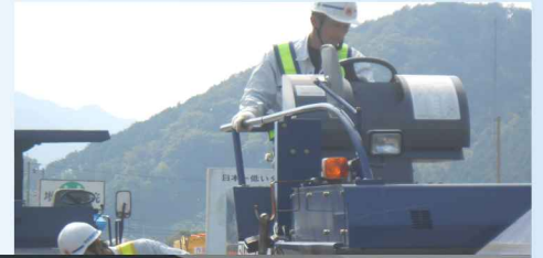
(国) 175号他舗装修繕工事