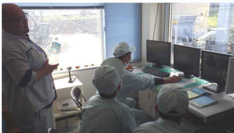
アスファルト合材製造体験