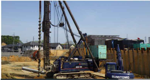
ドン・キホーテ基礎工事