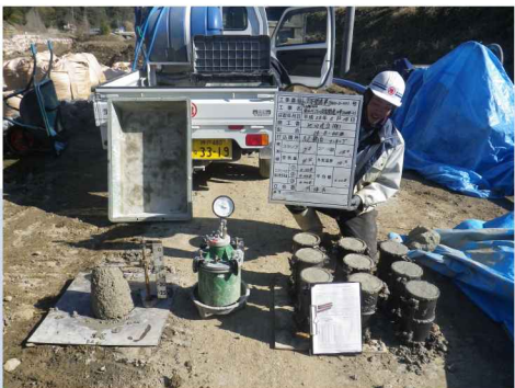
コンクリート試験立会