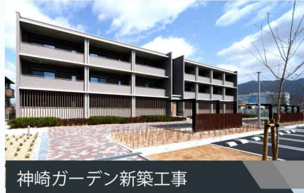
神崎ガーデン新築工事