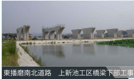
東播磨南北道路 上新池工区橋梁下部工事