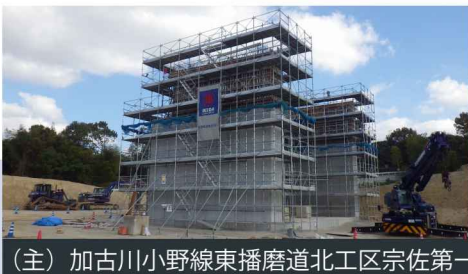
(主) 加古川小野線東播磨道北工区宗佐第一高架橋橋台工及び水路付替工事