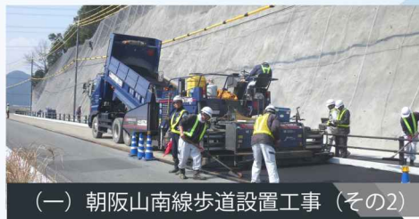
(一) 朝阪山南線歩道設置工事 (その2)