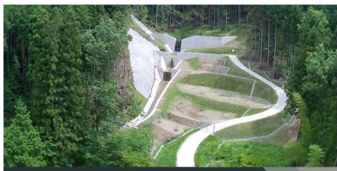
(砂) 南谷川砂防堰堤工事