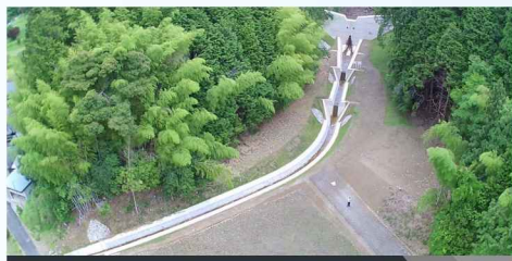
(砂) トンノク川砂防堰堤工事