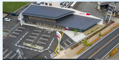
ドコモショップ丹波柏原店新築工事