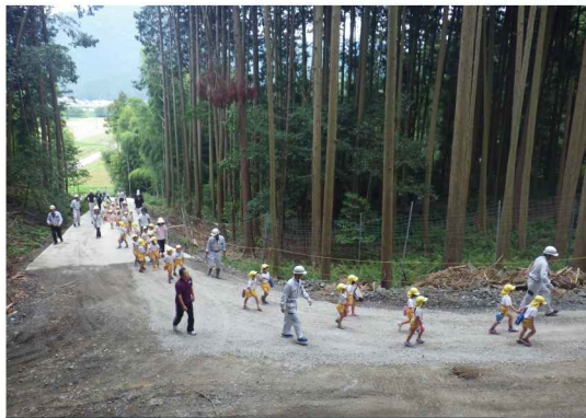
幸世川砂防堰堤工事 こども園園児の現場見学会