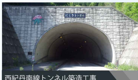
西紀丹南線トンネル築造工事