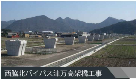
西脇北バイパス津万高架橋工事