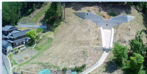
(砂) 徳尾谷上川砂防堰堤工事