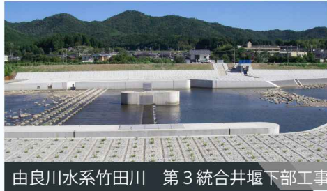
由良川水系竹田川 第3統合井堰下部工事