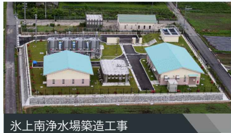
氷上南浄水場築造工事