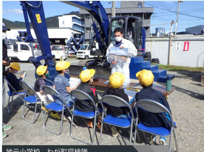
地元小学校 わが町探検隊