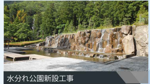
水分れ公園新設工事