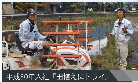
平成30年入社『田植えにトライ』