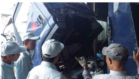
車両整備作業体験