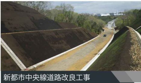
新都市中央線道路改良工事