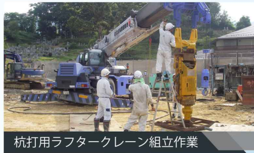
杭打用ラフタークレーン組立作業