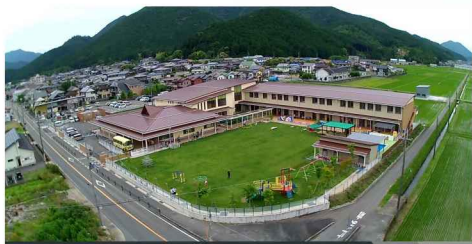
認定こども園ふたば建設工事