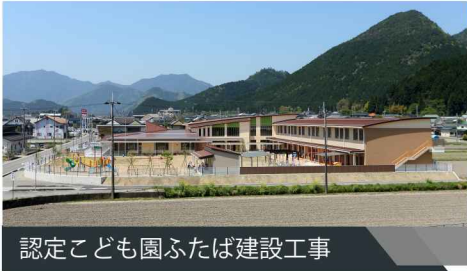
認定こども園ふたば建設工事